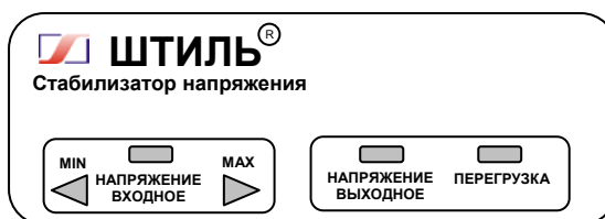
Рисунок 4.1 Передняя панель стабилизатора

На одной боковой стенке стабилизатора расположена розетка с заземляющим контактом для подключения нагрузки, а на другой – автоматический предохранитель 2А (у стабилизатора R250ST) или 5А (у стабилизаторов R400ST – R600ST), выключатель СЕТЬ и выведен сетевой шнур для подключения стабилизатора к сети.